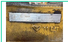
Serie Motor LH